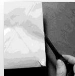
Öffnen – Scannen – gleichzeitig dabei Eingangsstempel und Zuweisung Fachabteilung