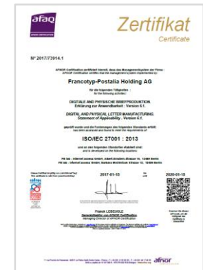
ISO/IEC 27001 : 2013 Informationssicherheit