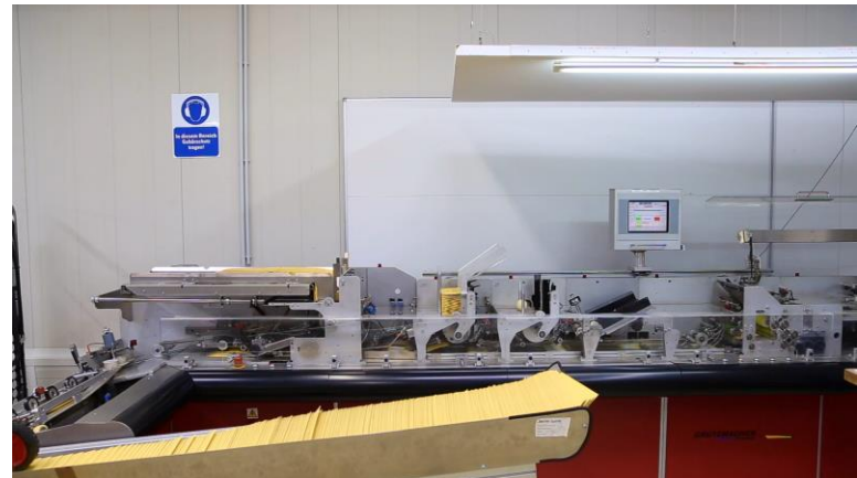
Produktionszentrum FP IAB Berlin-Adlershof