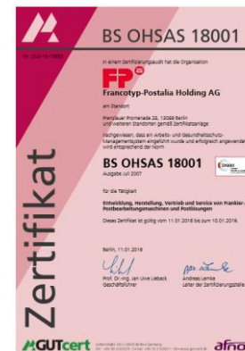
Arbeits- und Gesundheitsschutz