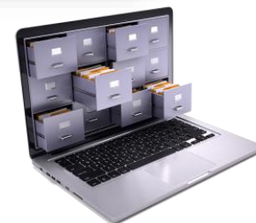
Elektronisches Archiv mit rechtkonformer Erhaltung